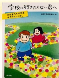
学校に行きたくない君へ： 大先輩たちが語る生き方のヒント。 全国不登校新聞社/編 ポプラ社