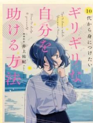
10代から身につけたい ギリギリな自分を助ける方法 井上祐紀/著 KADOKAWA

(これまで読書機会が少なかった生徒にも本に親しんでもらえる本も数多く揃えています)