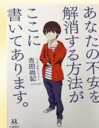
あなたの不安を解消する方法が ここに書いてあります。 吉田尚記/著 河出書房新社