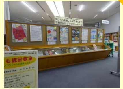
昨年度の展示の様子

昨年度の統計グラフコンクールの入選作品の展示や、統計グラフを作成するときに参考になるような図書の展示・貸出しを行います。